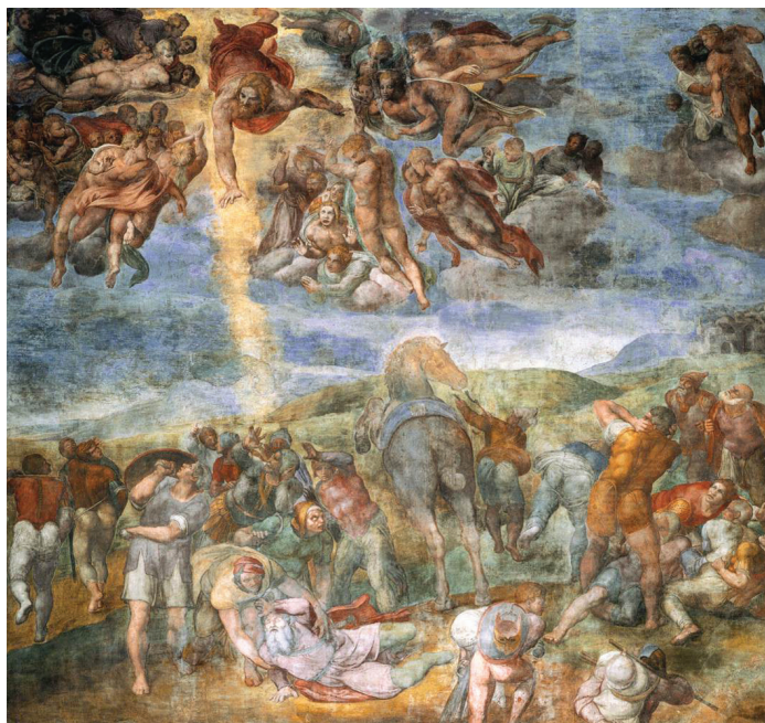
Michelangelo di Lodovico Buonarroti Simoni (1475-1564): Paulus' omvendelse.